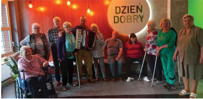
Uczestnicy COM korzystają z każdej okazji do integracji.