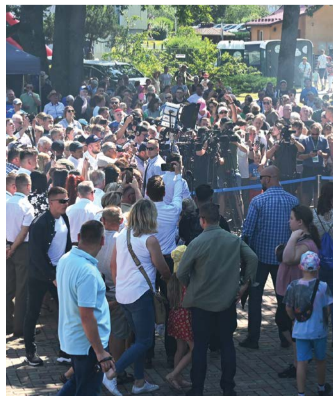
Podczas konferencji i spotkania z mieszkańcami.

W miasteczku „Rodzina 800+” przygotowano dla dzieci wiele atrakcji, gier i zabaw.