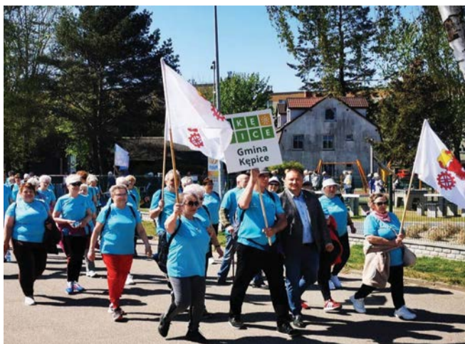
Silna ekipa reprezentowała seniorów z Gminy Kępice.

- Oczywiście wyniki są ważne, ale tak naprawdę liczy się to, że spędziliśmy tu wyjątkowo aktywnie czas. Udział w