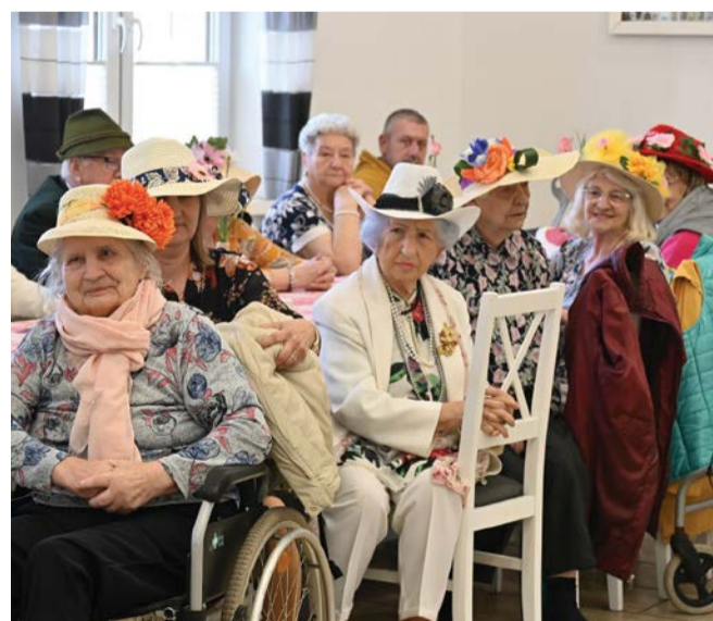
Uczestnicy COM zaprezentowali się w wyjątkowych strojach.

przyczyną do refleksji nad sytuacją osób z niepełnosprawnościami. Wsłuchujemy się uważnie w potrzeby tych osób, wspólnie starajmy się