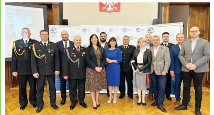
Samorządowcy z Powiatu Słupskiego podczas konferencji.

Bardzo dobra wiadomość dla strażaków ochotników z Korzybia, już wkrótce do jednostki trafi nowy ciężki samochód ratowniczo-gaśniczy.