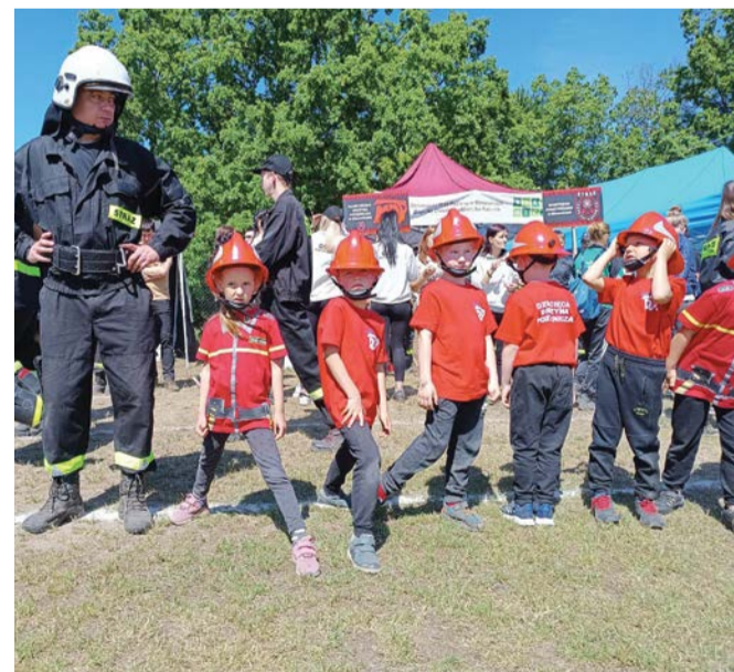
Kolejne pokolenie druhów w trakcie zawodów

– Już teraz stając na starcie zawodów jesteście zwycięzcami. To że angażujecie się w pomoc innym, a młodzieżowe drużyny uczą się nieść