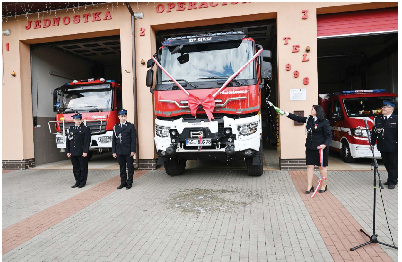
Oficjalne powitanie nowego wozu strażackiego w Kępicach.

- Nie sposób wymienić wszystkich, którzy dorzucili swoją cegiełkę do tego zakupu. Cieszymy się, że zawsze możemy liczyć na Wasze