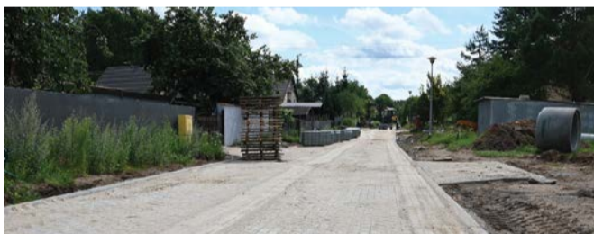
Aktualne zdjęcia z prowadzonych prac przy ul. 11 Listopada w Kępicach.