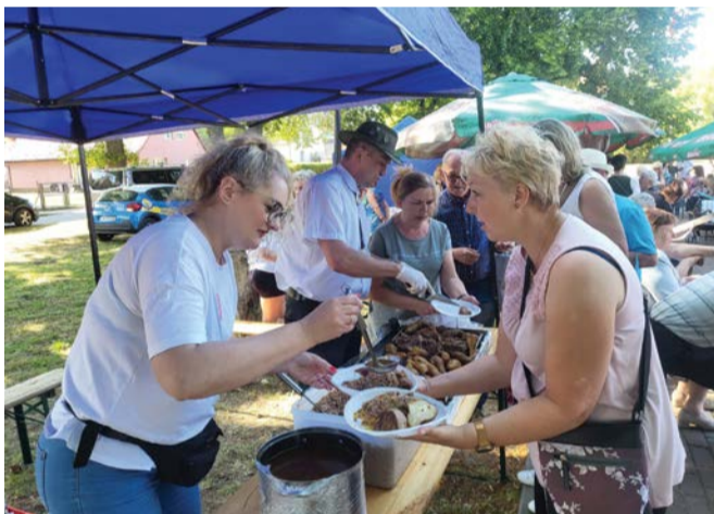
Mieszkańcy włączyli się w organizację parafialnej inicjatywy.

W czerwcu już po raz dwudziesty odbył się festyn parafialny w Kępicach.