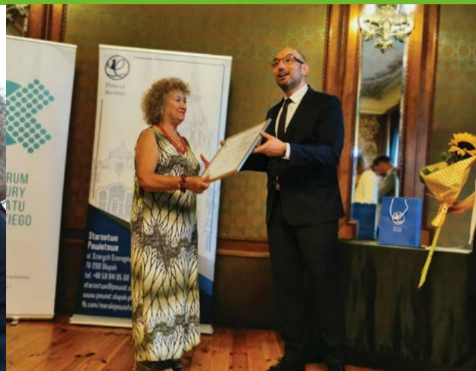
Nagroda od Starosty Słupskiego za wieloletnią działalność kulturalną.

Chciała być lekarzem, ale odkryty w młodości talent poprowadził ją inną ścieżką. Muzyka towarzyszy jej do dziś.