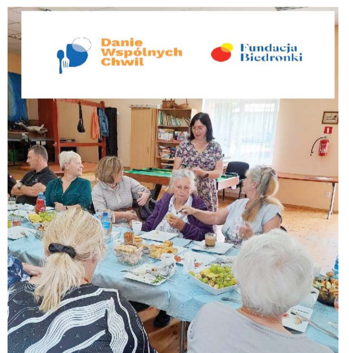
Mieszkańcy integrowali się w ramach pozyskanych środków z Fundacji Biedronka.

- Cieszę się, że nasi mieszkańcy aktywizują się i zdobywają środki na wspólne cele. Dzięki takim projektom umacniają się relacje społeczne. Mieszkańcy bardzo doceniają takie inicjatywy