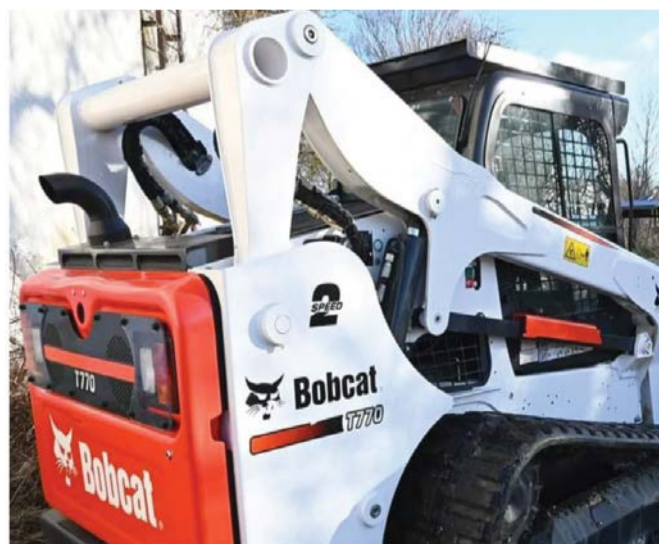
Z dotacji skorzysta Spółdzielnia Socjalna „Razem” oraz Centrum Integracji Społecznej.

CIS natomiast rozwinie istniejący warsztat krawiecki zakupując maszynę i hafciarkę. Oprócz tego