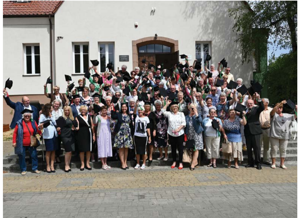
Słuchacze UTW zakończyli rok symbolicznym rzutem biretami.

było wręczenie wszystkim wykładowcom i członkom Uniwersytetu biretów symbolizujących zdobytą wiedzę.