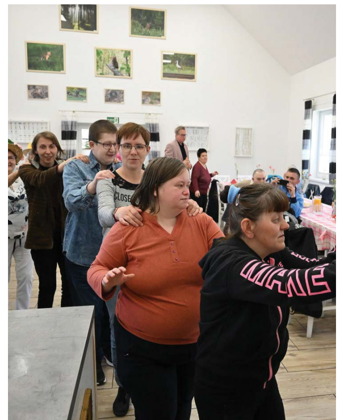
Spotkanie było okazją do wspólnej zabawy.