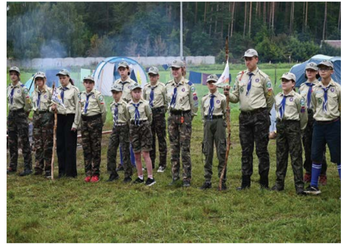
Skauci podczas porannej zbiórki.

W obozie biorą udział nawet siedmioletnie dzieci. Przez cały dzień z pełnym zaangażowaniem uczestniczą we wszystkich zadaniach, ale czasem wieczorem przychodzi moment tęsknoty za rodzicami i domem. Wtedy taki maluch otrzymuje wsparcie nie tylko od wychowawców,