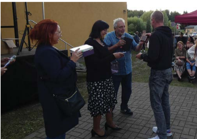
Podczas festynu, który odbył się 22 lipca w Obłężu.

szym licznym sponsorem. Tymczasem składam wszystkim zaangażowanym wielkie podziękowanie. Każdy z Was był niesamowity, jestem