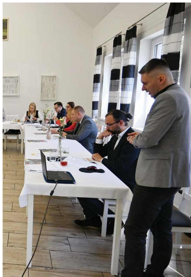
Samorządowcy podczas podpisania strategii rozwoju w Obłężu.

Kolejnym etapem działań, będzie przyjęcie przez poszczególne gminy stosownych uchwał. Po zakończonym procesie administracyjnym, partnerstwo będzie ubiegać się o środki z różnych programów w ramach kolejnej perspektywy finansowej na lata 2021-2027.