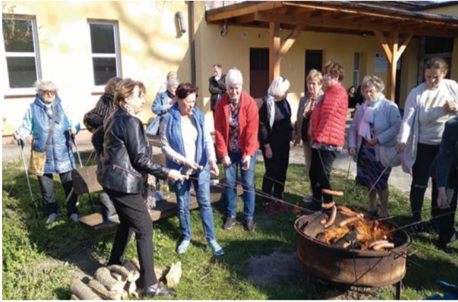
Na zakończenie spotkania odbyło się wspólne ognisko integracyjne.

Rada Seniorów na wyjazdowym posiedzeniu zachęcała mieszkańców do wspólnych działań.