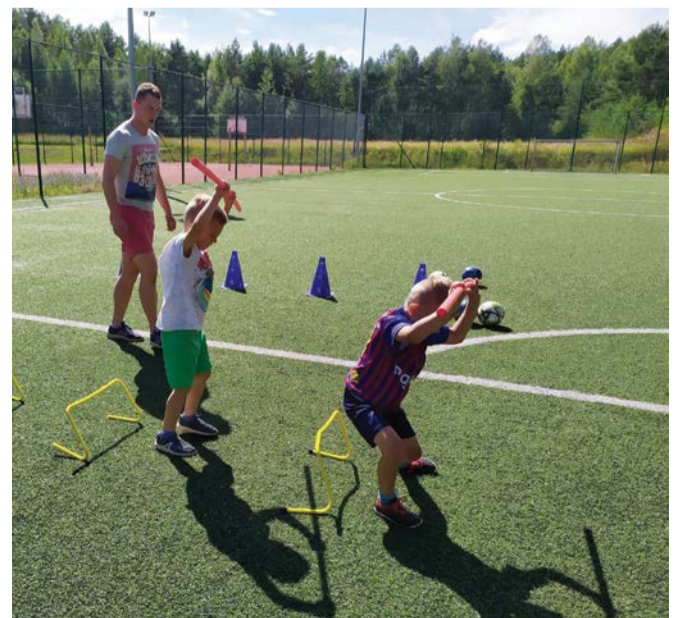
Mieszkańcy chętnie korzystają z kompleksu sportowego. Wkrótce przejdzie modernizację.

Zadanie jest współfinansowane ze środków Ministra Sportu i Turystyki w ramach Programu modernizacji kompleksów sportowych „Orlik” 2022.