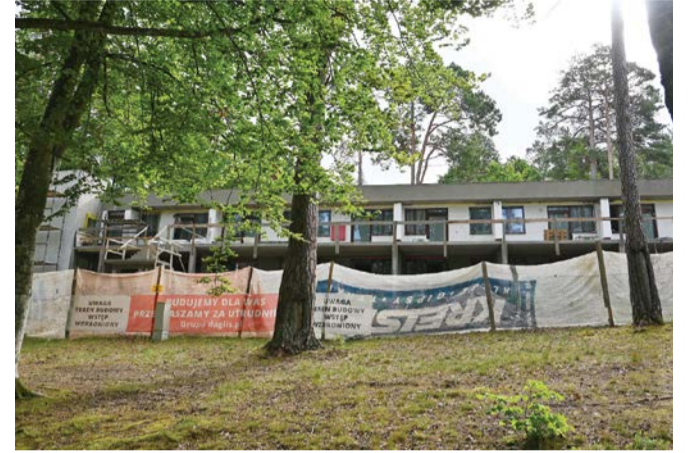
Aktualne zdjęcie z placu budowy.

Prace budowlane postępują. Ośrodek Wypoczynkowy „Sobótka” zyskuje właśnie ważny obiekt.