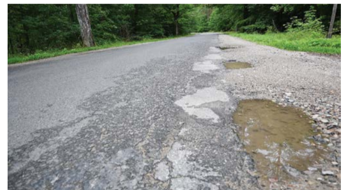
Kolejny odcinek drogi powiatowej będzie wyremontowany.

Dzięki współpracy i dofinansowaniu w Gminie Kępic będzie zmodernizowana kolejna droga.