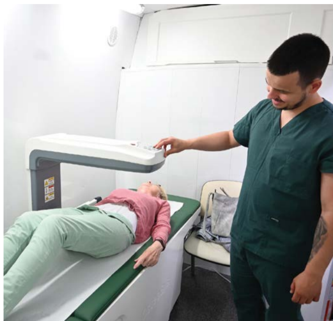
Bezpłatne badania profilaktyczne w Kępicach.

W czerwcu odbyła się ważna akcja, podczas której mieszkańcy naszej gminy mogli wykonać bezpłatne badania profilaktyczne w mobilnym osteobusie. To już kolejne takie wydarzenie w naszej gminie.