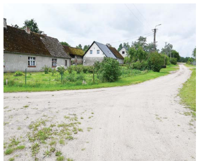
Droga w Mzdowcu będzie zmodernizowana jeszcze w tym roku.

Koszt zadania to niemal 600 tysięcy złotych, z czego dofinansowanie z Funduszu Leśnego to 494 900 zł. Inwestycja będzie wykonana jeszcze w tym roku.