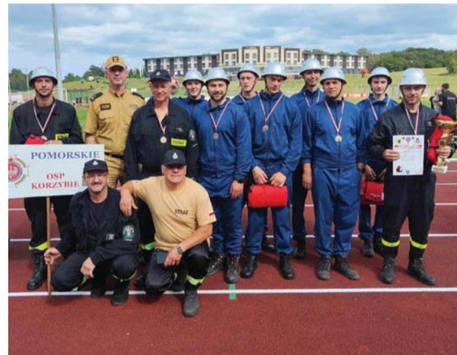
Drużyna z Korzybia wywalczyła miejsce na podium.

Druhowie z OSP Korzybie zdobyli wysokie miejsce w ważnych zawodach.