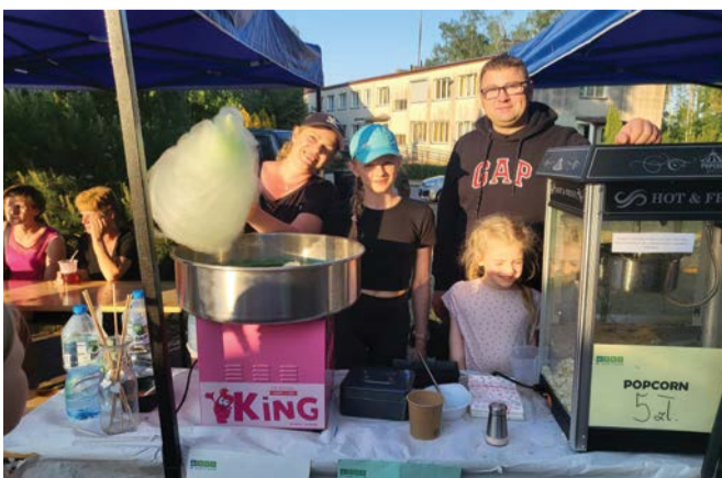
Podczas festynu można było skosztować wielu smakołyków.