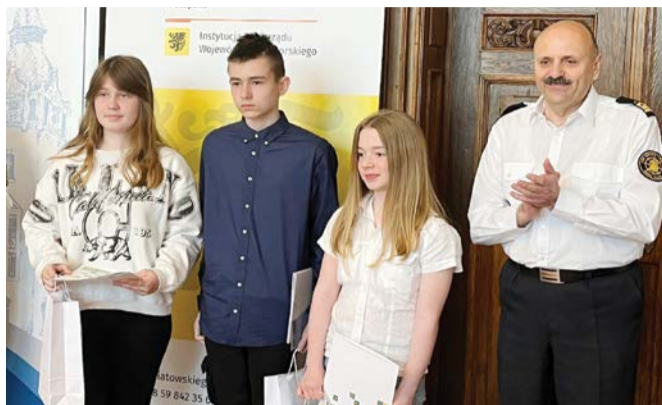
Uczniowie z Warcina wyróżnieni podczas konferencji.

Podczas ważnej konferencji wyróżniono mieszkańców Gminy Kępice. Podziękowania za edukację marynistyczną i żeglarską.