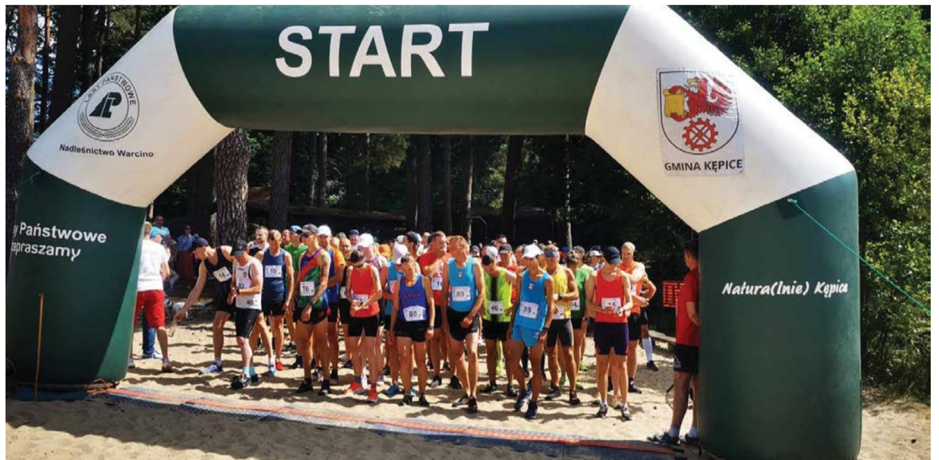
Uczestnicy tegorocznego biegu.

Do rywalizacji w XXIX Biegu im. Elżbiety Garduły w Korzybiu przystąpiło 105 osób, a do mety dobiegło 104 uczestników.