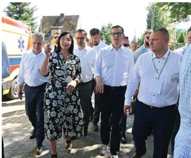
Premier Mateusz Morawiecki podczas wizyty w Kępicach.

Podczas briefingu, szef rządu odpowiadał na pytania dziennikarzy. Po jego zakończeniu uczestnicy pikniku mieli okazję przywitać się z Premierem, czy wykonać pamiątkowe zdjęcia. Mateusz