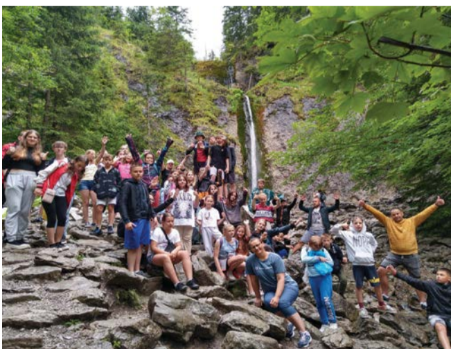
Uczniowie z Gminy Kępic na jednym z górskich szlaków.

- Współpraca międzygminna daje nam wiele satysfakcji.