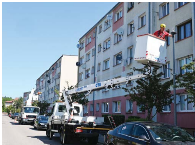
W Gminie Kępice przeprowadzono wymianę oświetlenia na energooszczędne.

Samorzady powinny świecić dobrym przykładem w zakresie oszczędzania prądu.