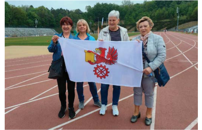
Przedstawiciele UTW w Kępicach.

Zdobyli pieniądze na kolejne działania. Będą poszerzać swoje zainteresowania!