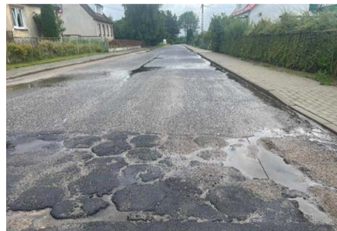
Aktualny stan odcinka drogi w Biesowicach przeznaczonego do modernizacji.

Szacowany koszt inwestycji to nieco ponad 714 tysięcy złotych. Środki na ten cel będą