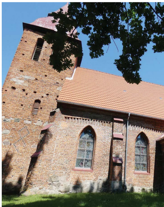
Dzięki pozyskanym środkom zyska m.in. zabytkowy kościół w Barcinie.

Z tej puli będą udzielone aż trzy dotacje dla parafii funkcjonujących w naszej gminie. Dzięki środkom zyskają kościoły w Barcinie, Osowie i Biesowicach. Będą tam przeprowadzone prace konserwatorskie uzgodnione z konserwatorem zabytków.