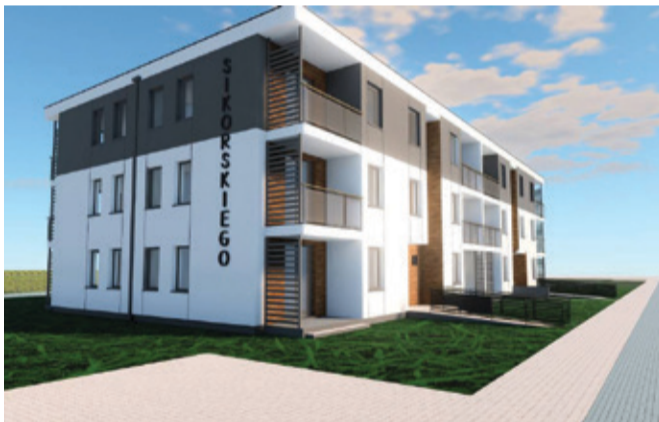
Przy ul. Sikorskiego powstaną dwa obiekty, w którym będzie 48 mieszkań.

W nowych obiektach powstaną dwu i trzypokojowe mieszkania, do których będą przynależać przestronne piw-