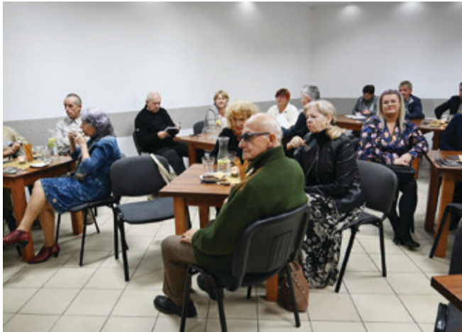
W spotkaniu udział wzięli przedstawiciele lokalnych instytucji, stowarzyszeń i artyści.

Uczestnicy spotkania zobowiązali się do podjęcia aktywności w dalszych rozważaniach w omawianych obszarach tematycznych. W najbliższym czasie będą odbywać się kolejne konsultacje, które docelowo mają doprowadzić do realizacji wspólnie poczynionych założeń.