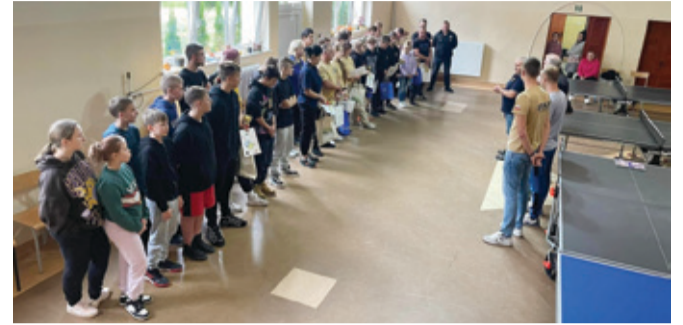
W turnieju udział wzięli druhnny i druhowie z jednostek OSP.

Strażacy zmierzyli się w turnieju. Uczcili pamięć wyjątkowej postaci.