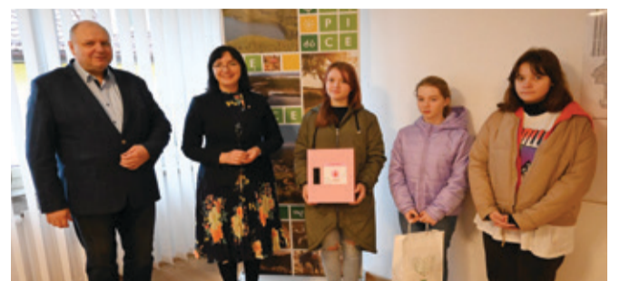
Różowe skrzynki trafiły do wszystkich szkół w naszej gminie.

W skrzynkach znajdują się podpaski i tampony, które są nieodpłatnie dostępne dla dziewcząt uczących się w