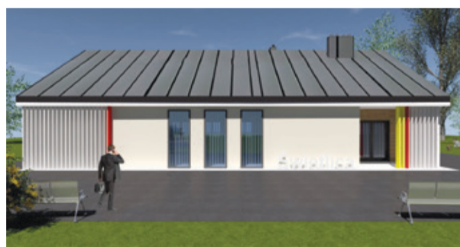
Wizualizacja świetlicy wiejskiej, która dzięki dofinansowaniu powstanie w Żelicach.