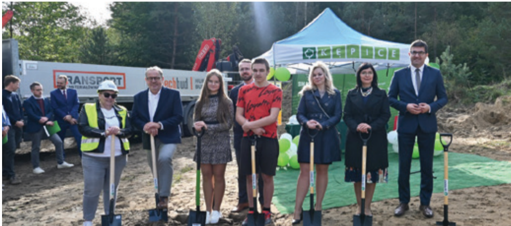
W październiku oficjalnie przekazano plac budowy Wykonawcy inwestycji.

- Liczymy, że budowa będzie przebiegać sprawnie. Realizacja zadania przewidziana jest na okres najbliższych dwóch lat. Z kolei już od teraz będzie prowadzony nabór, zatem potencjalni lokatorzy już będą mogli składać stosowne