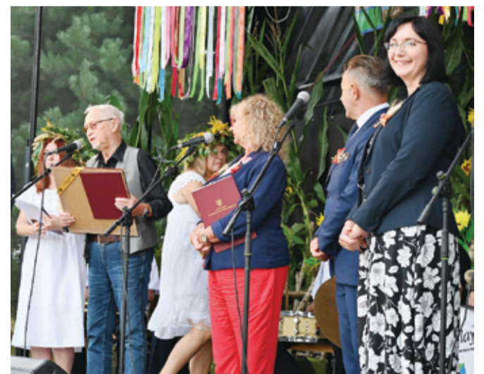
Prezes kępickiego HDK otrzymał wyróżnienie „Zwyczajny Niezwyčajny Senior”.