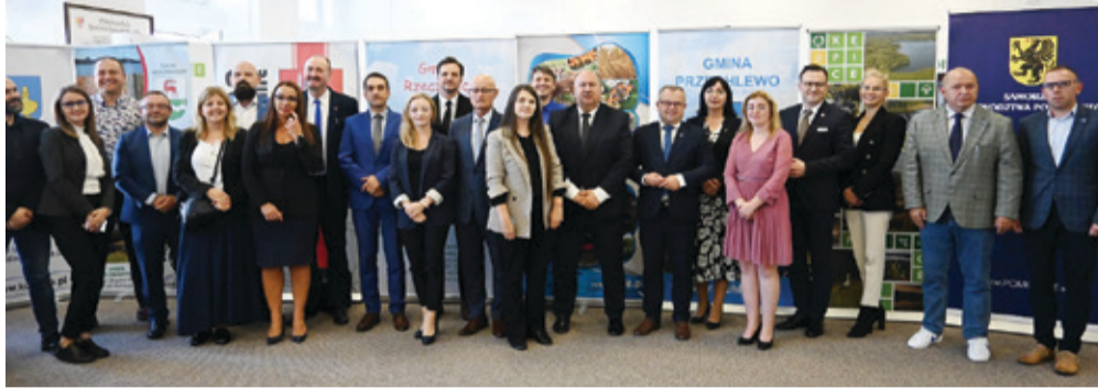
Samorządowcy z wielu gmin gościli na ważnym spotkaniu w Urzędzie Miejskim w Kępicach.