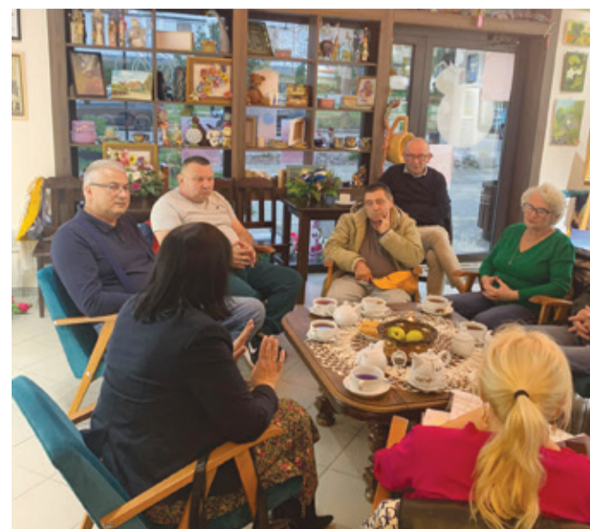
Kawiarenka obywatelska odbyła się w galerii ArtCafe w Kępicach.

W trakcie kawiarenki mieszkańcy mogli zapoznać się także z dokumentacjami projektowymi najważniejszych inwestycji.