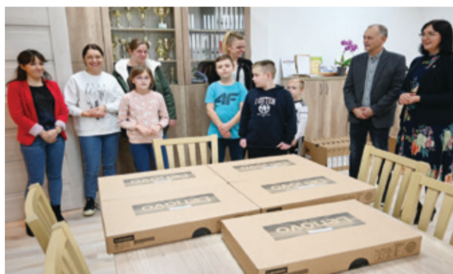
W listopadzie komputery trafiły do czwartoklasistów.

głym roku przekazaliśmy 380 laptopów dla uczniów z rodzin zamieszkujących Gminę Kępice, dzięki realizacji projektu pn. „Grant PGR – Wsparcie dzieci i wnuków byłych pracowników PGR w rozwoju cyfrowym”.