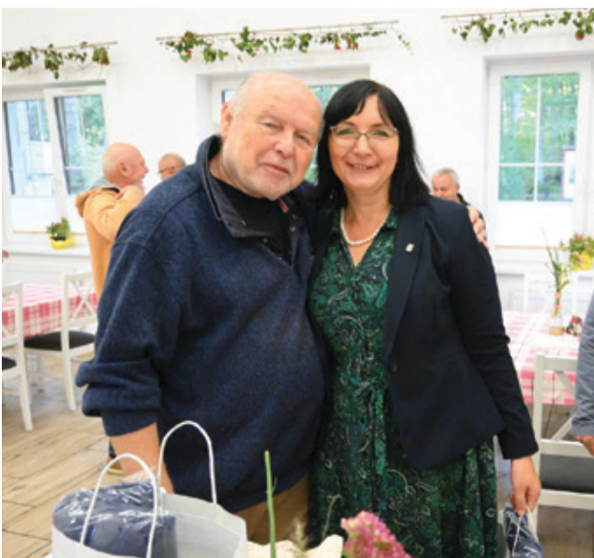
Współpraca z Gminą Walsrode trwa od 20 lat.