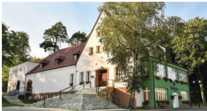
Dzięki dofinansowaniu zmodernizowane zostaną m.in. schody w budynku kępickiej biblioteki.

- Do drugiego naboru zgłosiliśmy trzy wnioski. Cieszymy się, że wszystkie zyskały aprobatę, dzięki czemu nasze zabytki odzyskują blask – mówi