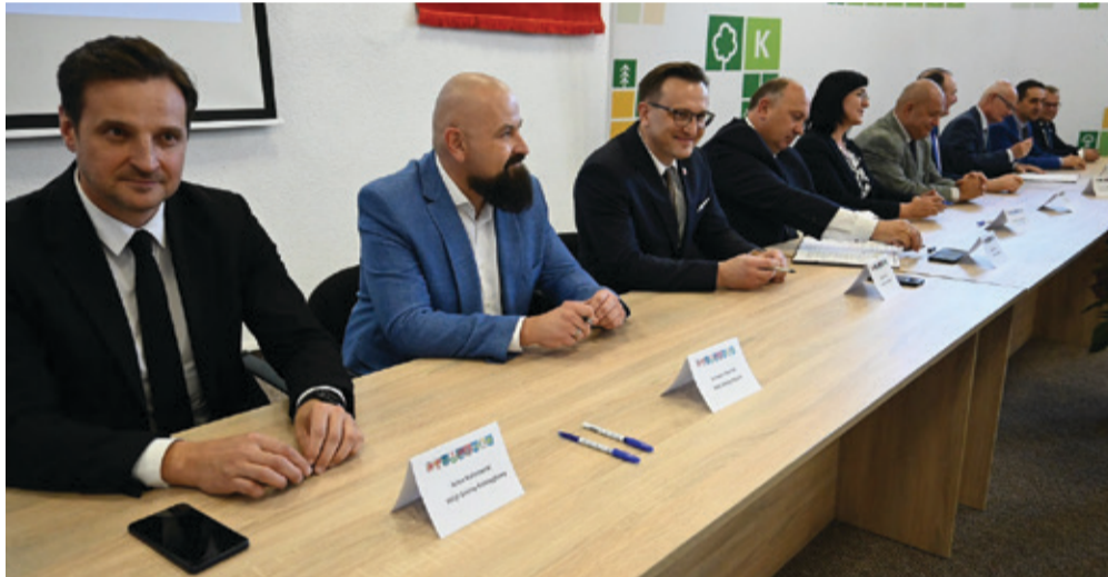
We wrześniu podpisano dokument, który ułatwi pozyskiwanie środków na rozwój w wielu dziedzinach.