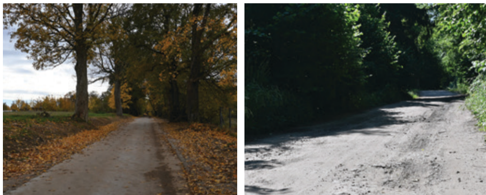
Aktualny wygląd zmodernizowanej drogi w Łużkach oraz przed rozpoczęciem inwestycji.

Kolejna inwestycja zakończona. Tym razem zmodernizowano drogę w Łużkach.