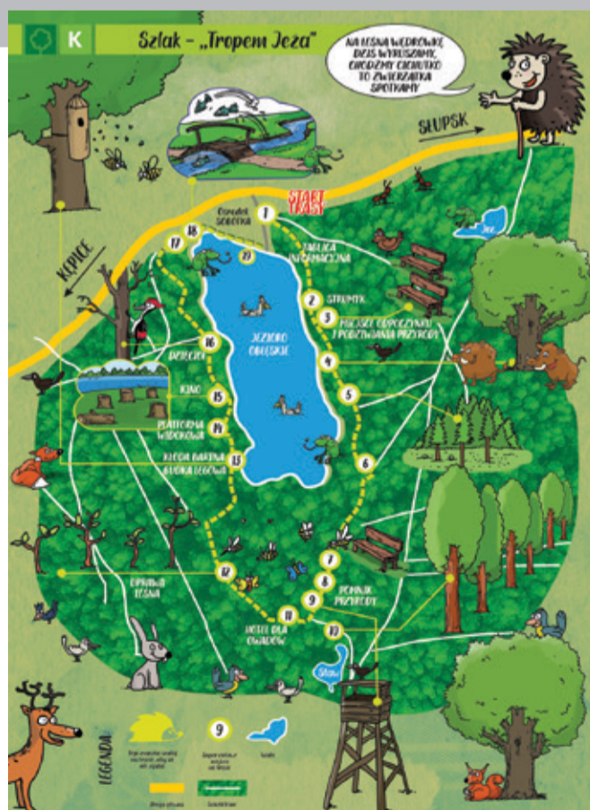
Mapkę „Tropem Jeża” można bezpłatnie otrzymać w recepcji Ośrodka Wypoczynkowego „Sobótka” w Obłężu.

Zadanie będzie wykonane w partnerstwie z Nadleśnictwem Warcino. Zgodnie z harmonogramem realizacji, od-