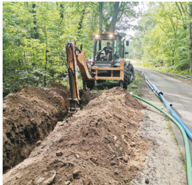
W ramach inwestycji wartej 3 mln złotych powstaje nowa sieć wodociągowa – kanalizacyjna.

Zadanie jest dofinansowane z Unii Europejskiej w ramach Programu Rozwoju Obszarów Wiejskich na lata 2014–2020 typ operacji „Gospodarka wodno-ściekowa” w ramach