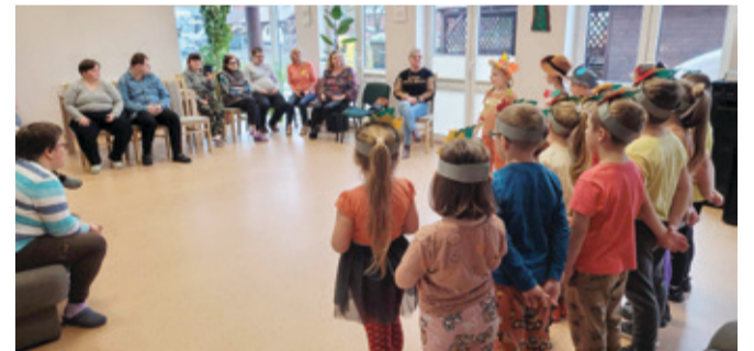
Dzieci z kępickiej „zerówki” podczas występu dla podopiecznych ŚDS.

Chcą się dzielić z innymi, tym co mają najlepsze. Mieszkańcy wzajemnie się wspierają.