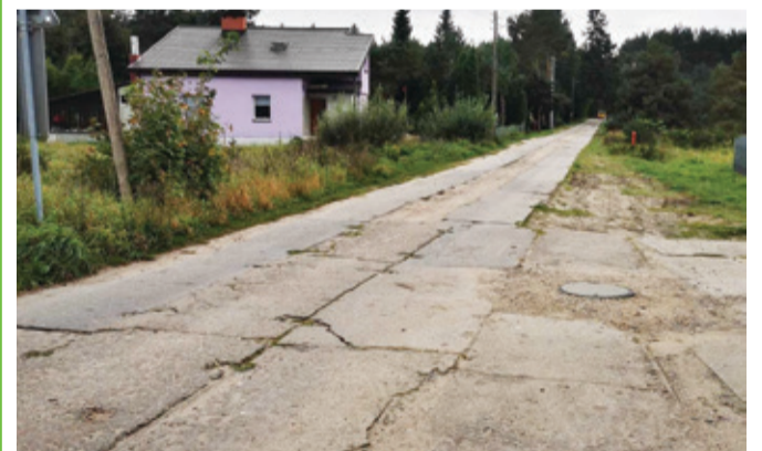
Obecny stan ulicy Łętowskiej w Korzybiu.

Gmina Kępice otrzymała dofinansowane na kolejną drogę. Prace ruszą w przyszłym roku.