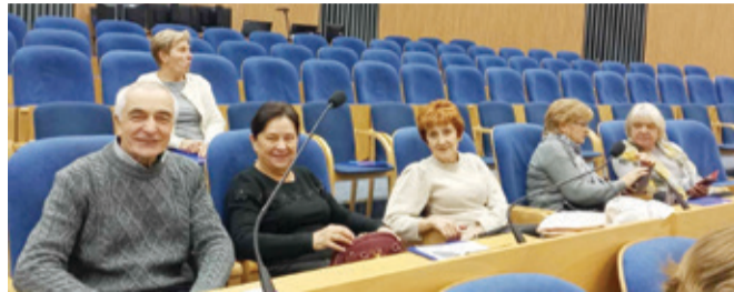
Przedstawiciele kępickiego UTW podczas gdańskiego Forum.

Rozmawiali o działalności Uniwersytetów Trzeciego Wieku. Przedstawiciele z Kępicy na ważnym Forum.