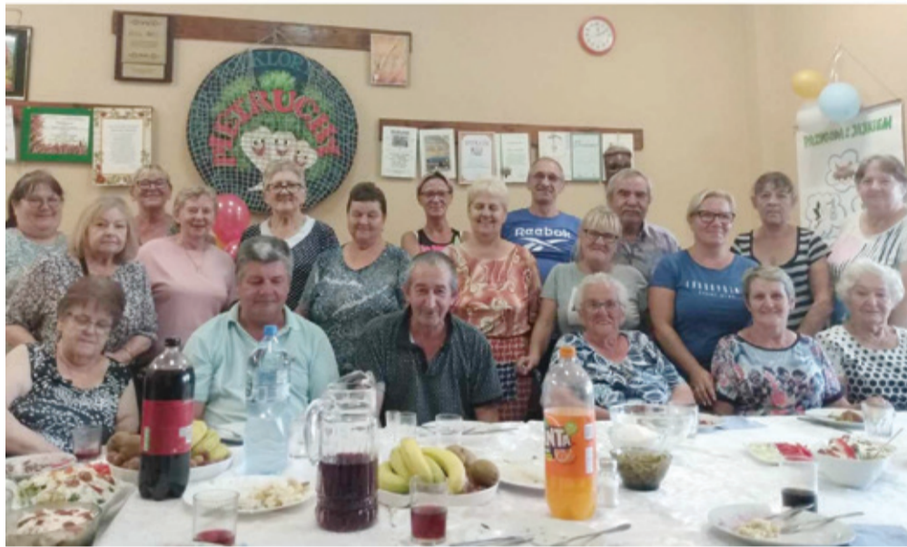
KGW „Pietruchy” podarowały wspólne chwile biesowickim seniorom.

Koła, które biorą udział w programie, wspierane są też przez dietetyka klinicznego, który edukuje uczestników na temat żywienia seniorów. Koła otrzymują więc przepisy dostosowane do potrzeb seniorów, porady i materiały edukacyjne.