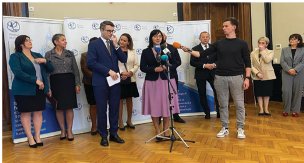
Samorządowcy Powiatu Słupskiego podczas konferencji prasowej Ministra Piotra Mullera.

– Dzięki temu zakupowi polepszymy codzienne funkcjonowanie podopiecznych naszych instytucji, jak choćby Środowiskowego Domu Samopomocy, Centrum Opiekuńczo – Mieszkalnego, Ośrodka Pomocy Społecznej czy Centrum Integracji Spo-