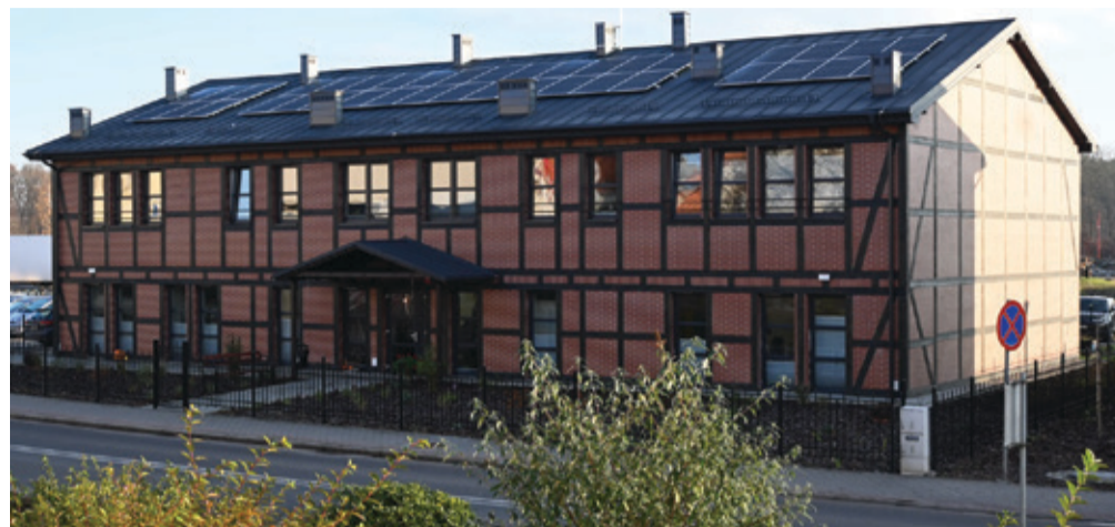
Panele fotowoltaiczne pojawiły się już m.in. na dachu Centrum Opiekuńczo – Mieszkalnego w Kępicach.

Projekt pn. „Odnawialne Źródła Energii dla mieszkańców w Gminie Kępice” jest współfinansowany z Regionalnego Programu Operacyjnego Województwa Pomorskiego na lata 2014 – 2020, w ramach działania 10.3.1. Odnawialne Źródła Energii – wsparcie dotacyjne.