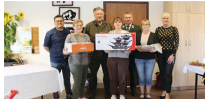
Laureaci konkursu kulinarnego.

Uwielbiają leśne klimaty. Zorganizowali już drugą edycję wyjątkowego eventu.