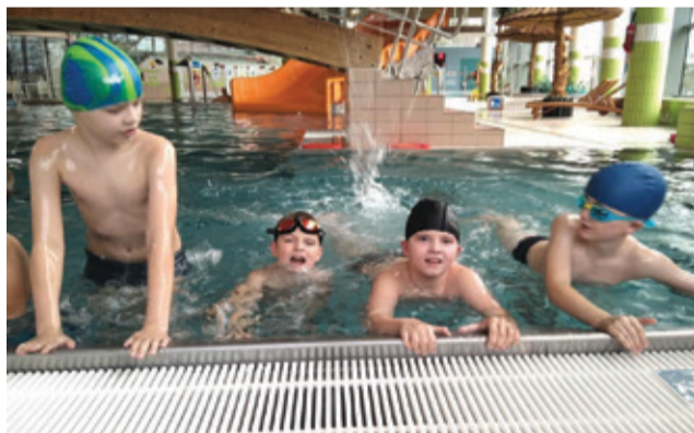
Dzięki realizowanemu projektowi, dzieci z naszych szkół uczą się pływać.

Łącznie ze wszystkich szkół z naszej gminy,