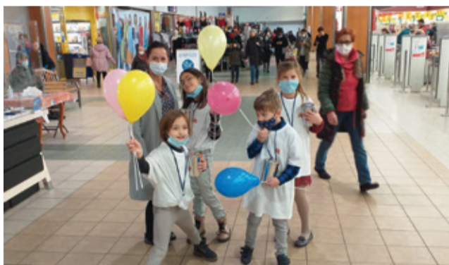
Wolontariusze zbierali karmę dla zwierząt.