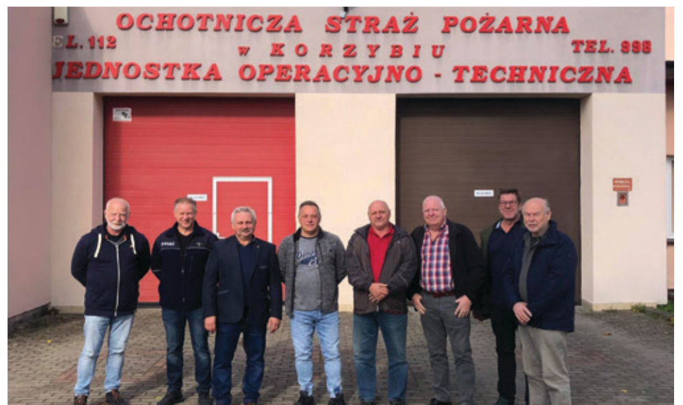
Goście odwiedzili m.in. kilka jednostek OSP w naszej gminie.