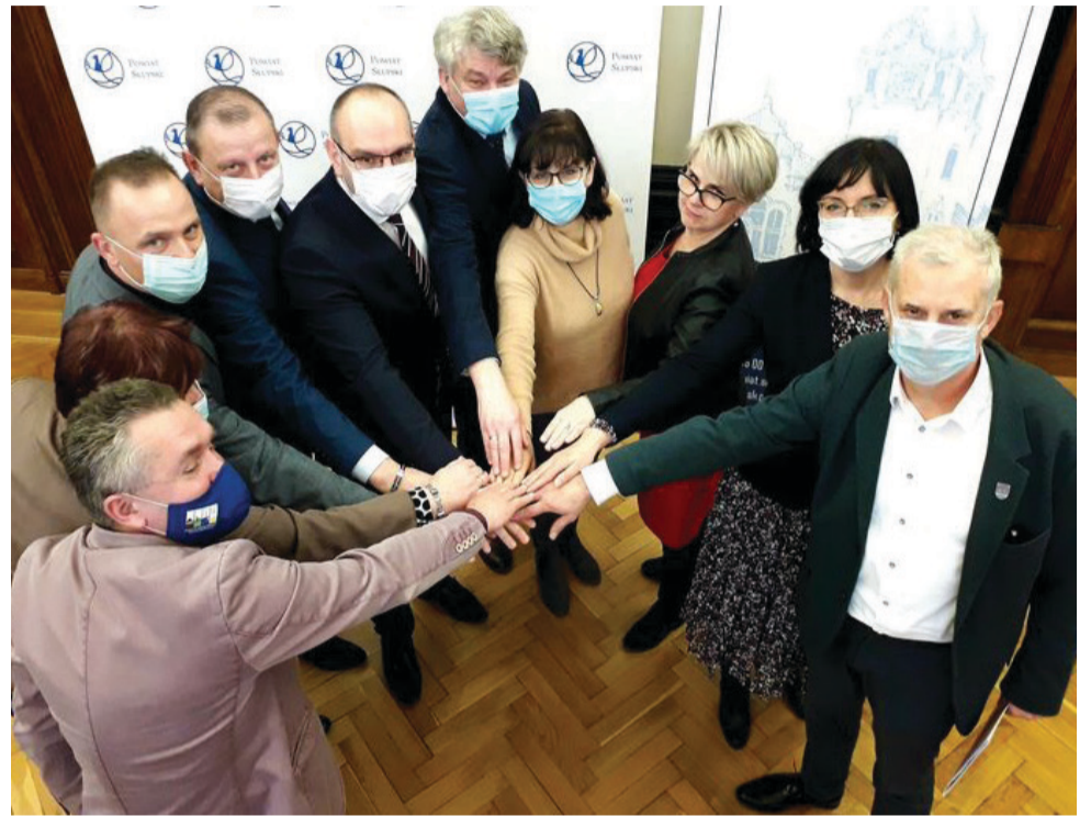
Samorządowcy z naszego powiatu, będą wspólnie zabiegać o środki na rozwój.