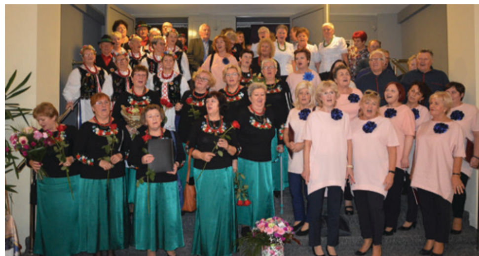
W koncercie jubileuszowym wzięli udział chórzyści oraz wielu zaproszonych gości.