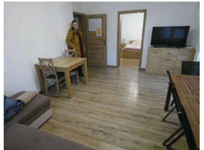
W ośrodku funkcjonują całoroczne apartamenty.