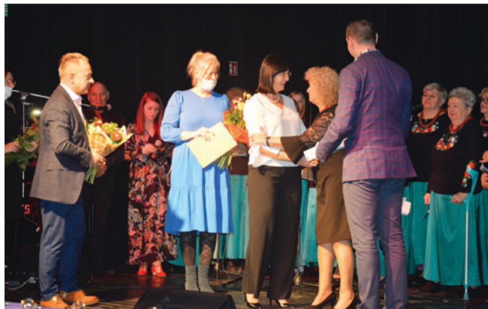
W trakcie koncertu, Jubilatом składano wiele życzeń i wręczono okolicznościowe upominki.