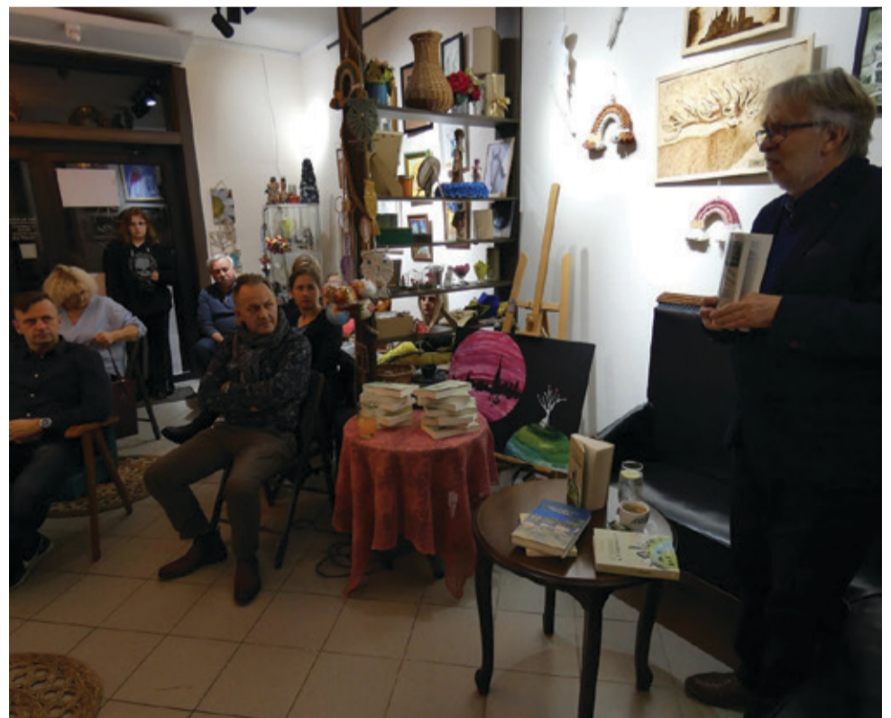
Znany dziennikarz i regionalista promował w Kępicach swoją książkę. Do galerii ArtCafe licznie przybyli mieszkańcy naszej gminy, żeby spotkać się z autorem.

Autor czytając swoje teksty, przypomniał historię przemian, które dokonywały się w naszej gmi-