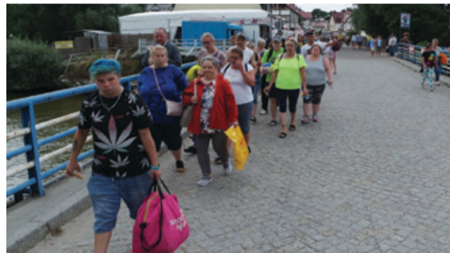
Uczniowie klas pierwszych otrzymali od Pani Burmistrz upominki.

W projekcie udział wzięło kilkudziesięciu podopiecznych Środowiskowego Domu Samopomocy w Kępicach, którzy w okresie ostatnich miesięcy brali udział w plenerach fotograficznych w naszym regionie. - Projekt „Kolory życia”, skupiał się na nauce fotografowania, głównie przyrody w trakcie sesji