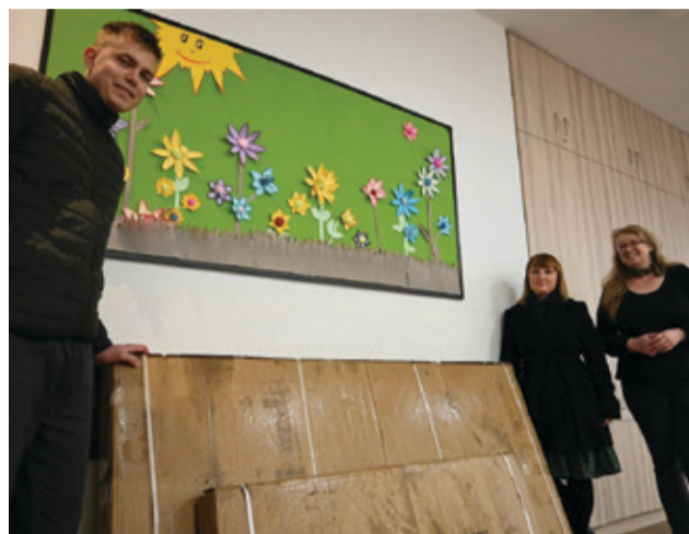
Sprzęt, który ma pomóc w integracji został przekazany do 17 świetlic w naszej gminie.

Sprzęt został przekazany do 17 miejscowości naszej gminy. Jego zakup został współfinansowany ze środków Państwowego Funduszu Rehabilitacji Osób