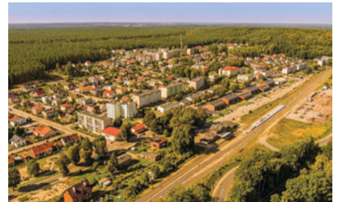
Dzięki pozyskanym środkom, mieszkańcy naszej gminy zakładają działalność gospodarczą.

Właśnie podpisano kolejnych 10 umów po zakończonej drugiej turze