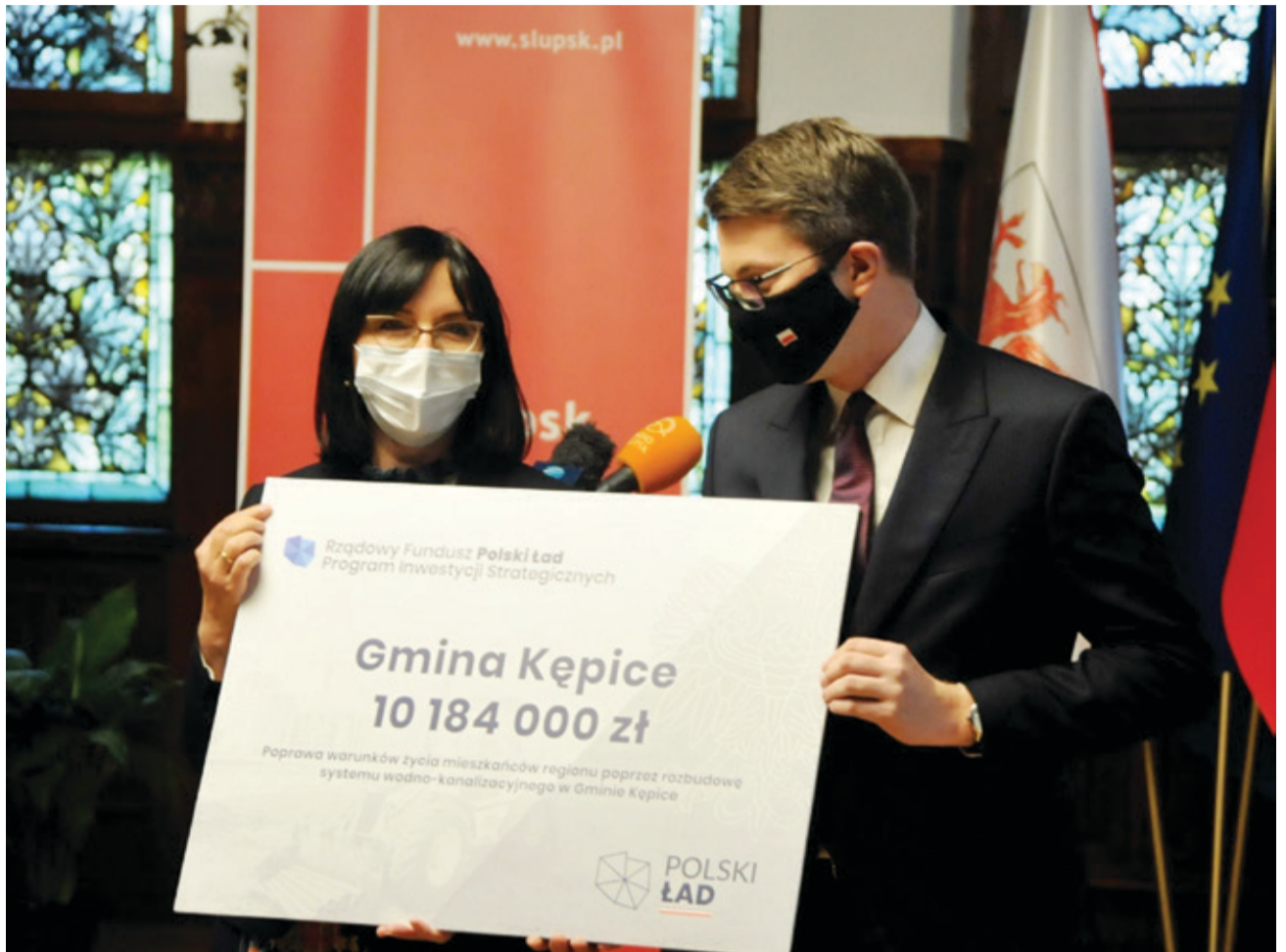
Ponad 10 milionów złotych nasza gmina otrzyma na inwestycje wodno-kanalizacyjne.

Wartość planowanych inwestycji wyceniono na kwotę 10 720 000,00 złotych, z czego 10 184 000,00 złotych pokryje fundusz Polski Ład. Środki będą przeznaczone na budowę kanalizacji sanitarnej w miejscowościach Osowo, Warcino, Łużki, Obłęż do Ośrodka Wypoczynkowego „Sobótka” oraz budowę sieci wodociągowej w Korzbiu. Łącznie dzięki tym inwestycjom powstanie min. 3 170 m sieci wodociągowej i min. 7 842 m sieci kanalizacyjnej sanitarnej grawitacyjnej i tłocznej.