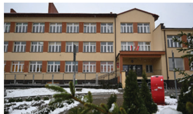
Szkoly naszej gminy otrzymały środki na zakup wyposażenia technicznego.

Laboratoria Przyszłości to nowoczesny sprzęt, który uatrakcyjni zajęcia