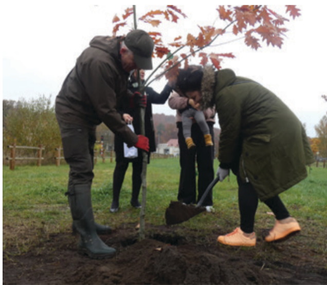
W kępickim Parku Pokoleń, kolejni mieszkańcy zasadzili swoje drzewka.

Kolejne roczniki mieszkańców naszej gminy mają swoje drzewka.