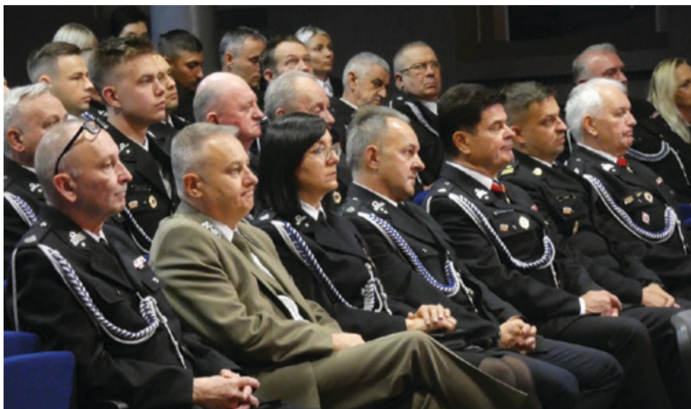
Podczas zjazdu podsumowano pięcioletni okres działalności naszych OSP.

Strażacy z naszej gminy wybrali nowy zarząd. To ważne wydarzenie w życiu Ochońniczych Straży Pożarnych.