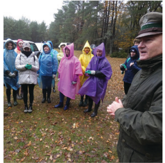
Nad prawidłowym przebiegiem sadzenia jabłonek, czuwali leśnicy.

Nadleśnictwa Warcino. Drzewka owocowe t.j. jabłonie, grusze, śliwy to gatunki dostarczające zwierzynie zarówno żeru pędowego i soczystych liści, ale przede wszystkim to gatunki dostar-