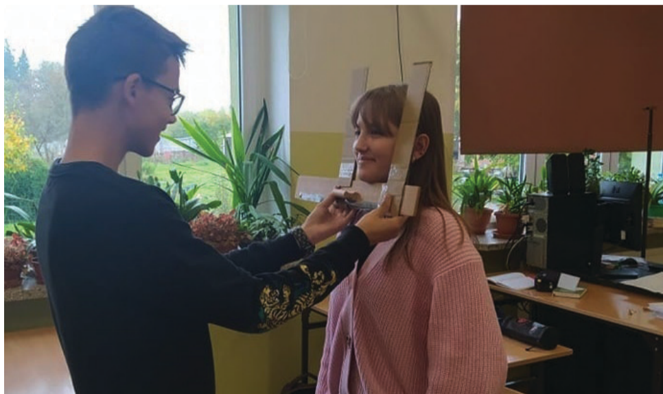
W biesowickiej szkole realizowany jest niezwykle projekt.

Kolejnym etapem projektu było zorganizowanie konkursu pod tajemniczym tytułem „Złoty prostokąt”. Każdy uczestnik miał narysować prostokąt, który według niego jest idealny, a zespół projektowy sprawdził potem, która figura spełnia zasadę