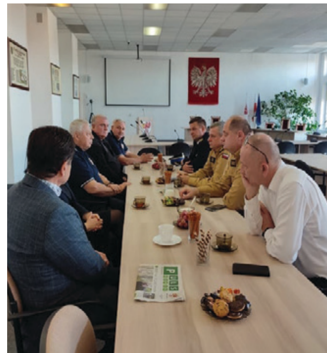
W spotkaniu udział wzięli strażacy i samorządowcy.