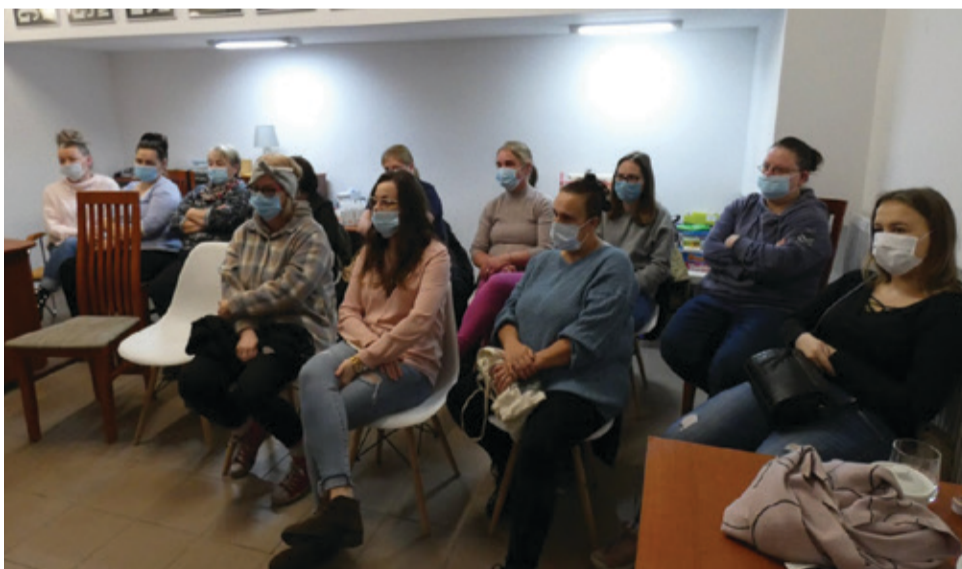
Uczestnicy CiS-u wzięli udział w targach pracy.

Wcześniej uczestnicy odwiedzili także lokalne zakłady pracy, zapoznając się z ich specyfiką. – Teraz zorganizowaliśmy targi pracy, do udziału w których zaprosiliśmy lokalnych przedsiębiorców – informuje Aleksan-