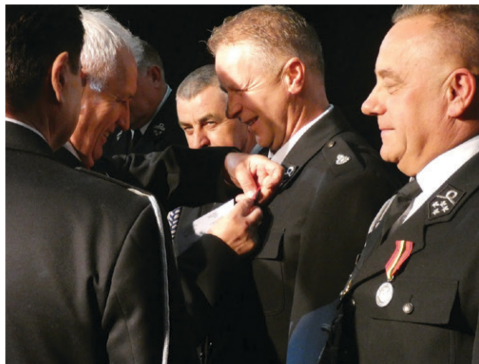
Odnaczono zasłużonych strażaków.