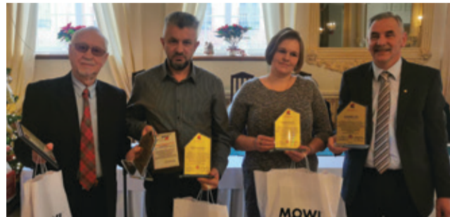
Reprezentacja klubu na Rejonowych Obchodach Dni HDK.

Tekst: A. Itrowska - Garus, J. Flegel