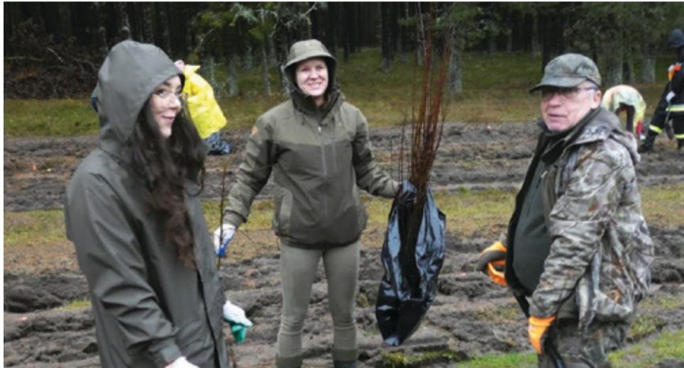
W akcji sadzenia udział wzięli przedstawiciele wielu profesji.

W ramach zainicjowanego przez naszych leśników przedsięwzięcia, w sumie zostało posadzonych 2 tysiące sztuk sadzonek jabłoni płonki na długości 1,5 km. Akcja sadzenia drzew jabłoniowych odbywa się pod hasłem „Nasadenie alei rodzimych gatunków drzew owocodajnych i miododajnych na terenie Nadleśnictwa Warcino” w ramach projektu dofinansowanego przez