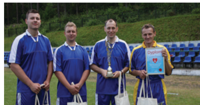
Zwycięska drużyna Rejonowej Spartakiady.